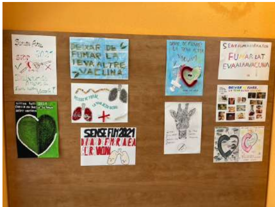
Germanes Hospitalàries del Sagrat Cor de Martorell

Hosp. Germans Trias @hgermantrias Estem a la XXII Setmana sense fum. A #hgermantrias ens sumem a les accions de sensibilització amb una exposició dels rètols anuals de l'esdeveniment, al passadís de la planta baixa. Deixar de fumar, la teva altra vacuna #ssfcat21 #sumasalut